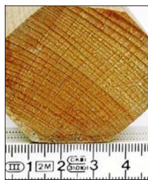
Mit solch dicken Kanthölzern sollen die Angeklagten zugschlagen haben.

Als uns die Nachricht erreichte, unser Sohn sei Opfer eines Überfalls geworden und liege im Krankenhaus, drehten wir fast durch. Schnell ins Auto und ab nach Mössingen. Dort angekommen, fanden wir unseren Sohn vor: blutüberströmt mit einer riesigen Platzwunde auf der Stirn, schwere Gehirnerschütterung und blaue Flecken am ganzen Körper. Völlig desorientiert stellte er immer wieder die gleichen Fragen: »Was ist passiert?« - »Wo bin ich?« - »Wie geht es meinen Kumpels?« Was in uns, seinen Eltern, vorgeht, kann ich fast nicht in